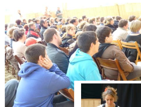
Un public concentré