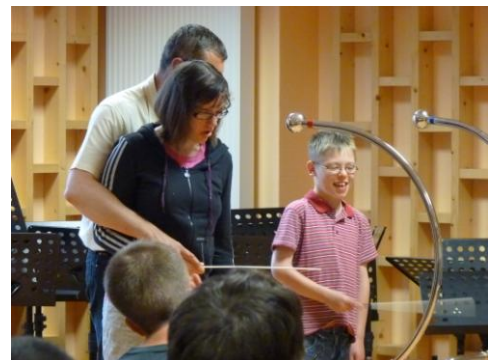
BAO PAO – Maison de la Musique à Falaise