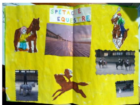
Les dessins réalisés à la suite de cette journée.